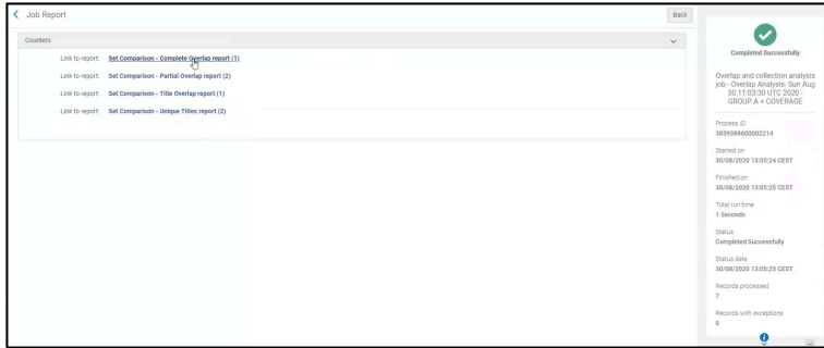
重複およびコレクションアナリシスジョブレポートの例